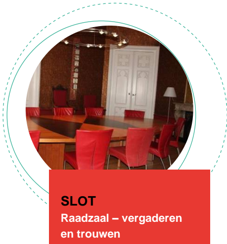
SLOT Raadzaal – vergaderen en trouwen