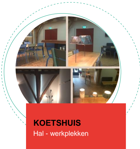
KOETSHUIS Hal - werkplekken

Slot Rossum met het koetshuis is een goede locatie voor trainingen en bijeenkomsten met onze relaties. Regelmatig organiseren we hier workshops, practica en brainstormsessies. Er zijn verschillende ruimtes ingericht als trainingsruimte, spreekkamer en flexibele werkplek.